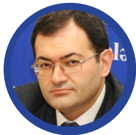
Интигам Бабаев, заместитель Министра молодежи и спорта Республики Азербайджан